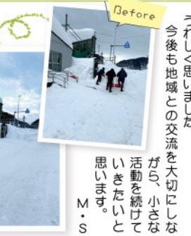
買い物全しずりだじゃあ〜!

にしやま事業所の職員さん... 笑顔で薄く... 涙を浮かべながら話してくれました。